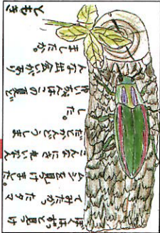
タムシと出会えた感動が伝わると思います。と思います。