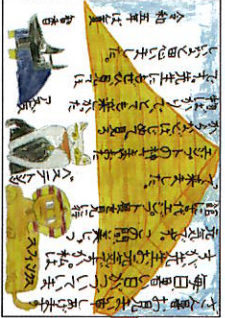
本物のエジプトの遺跡をはじめ、間近で見たら、とてもきれいで驚きました。物知りな先生が見ても、きっと驚くだろうなと思います。