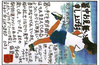
走ると美しい風景が広がって、すくく気持ちがいいです。いつか先生と一緒に走りたいです！